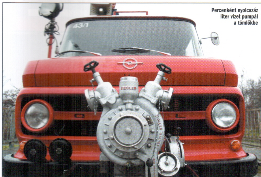
Percenként nyolcszáz liter vizet pumpál a tömlőkbe